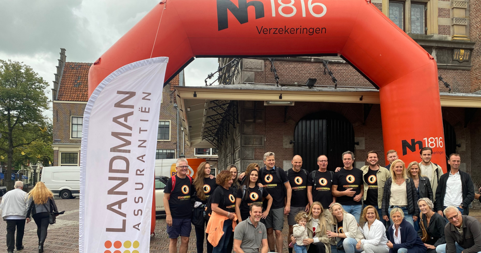
NL wandelt voor Usher