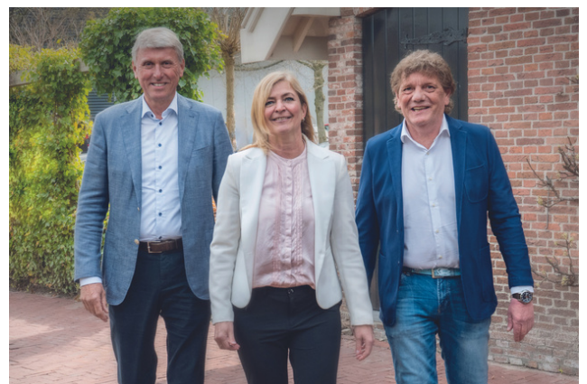
Bestuur Coöperatie Nh1816

We zijn trots dat we dit jaar 117 initiatieven hebben kunnen ondersteunen en daarbij ruim 200.000 euro aan goede doelen hebben gedoneerd.