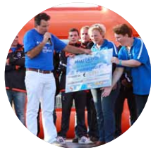
DOE EEN WENS NEDERLAND

Daarmee bieden we consumenten, onze verzekerden, meer dan de beste producten en diensten. We helpen hen ook maatschappelijk verder. Ga voor meer informatie naar www.nh1816.nl/mvo