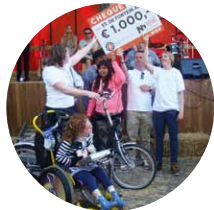
ST. DE FONTEIN AALST