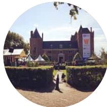
BITES & BEATS